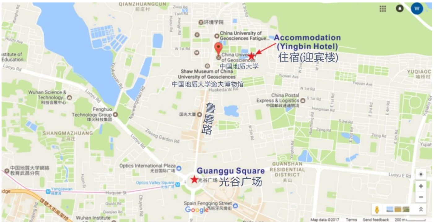
图 1：迎宾楼及光谷广场位置图

住宿： 坐落于中国地质大学（武汉）校园内的迎宾楼（图 1）可提供一定数量房间，如需预订校内住宿，请于 2017年7月1日 前联系 3dwc2017@cug.edu.cn 预留房间。